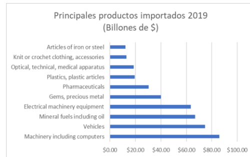
PRINCIPALES PRODUCTOS IMPORTADOS 2019